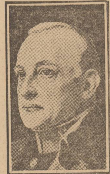
PRIMO DE RIVERA