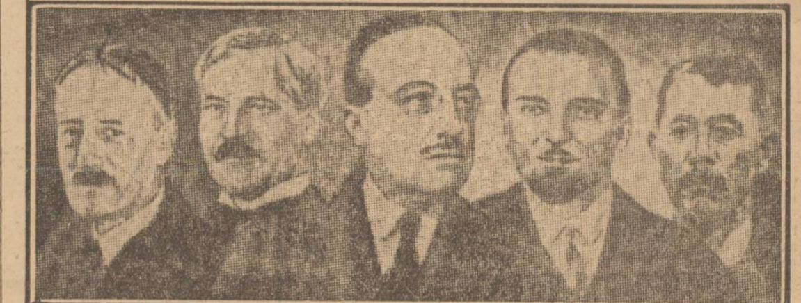
SEFII CELOR CINCI DELEGAȚIUNI. — Dela stânga la dreapta d-nii Stimson (Statele-Unite); Macdonald (Anglia); André Tardieu (Franța); Grandi (Italia) și Wakatsuki (Japonia).